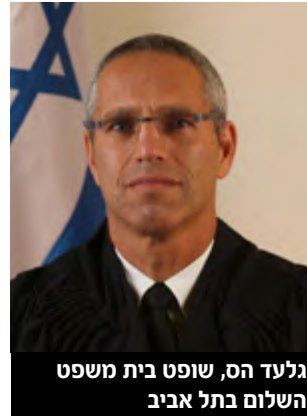
גלעד הס, שופט בית משפט השלום בתל אביב

לאור זאת, קיבל השופט את התביעות באופן מלא וקבע כי לחברת המוניות ישלמו הנתבעים 43,768 שקל, בצירוף הפרשי הצמדה וריבית מיום הגשת התביעה ועד התשלום בפועל. למכונית הפרטית שהינה מבוטחת על ידי הכשרה נקבע כי הנתבעים ישלמו 17,300 שקל בצירוף הפרשי הצמדה וריבית מיום הגשת התביעה ועד ליום התשלום בפועל. הודעות צד ג' בשני התיקים מתקבלות בחלקן, כך שצד ג' ישפה את הנתבע בסך של 60% מהתשלומים שזה ישלם בפועל לתובעים בתיקים אלו.