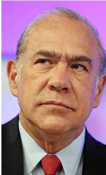
מנכ"ל ה־OECD אחל גוריה

הנפגעים העיקריים הם משקי הבית והעסקים הקטנים. הכלכלה הישראלית רק תרוויח אם תהיה יותר תחרות במערכת הבנקאות. בהקשר זה מומלץ כי המדינה תבחן את האפשרות להכניס את בנק הדואר לתחום הפעילות הבנקאית בגווייה השונים, בדומה למקובל בכמה ממדינות ה־OECD.